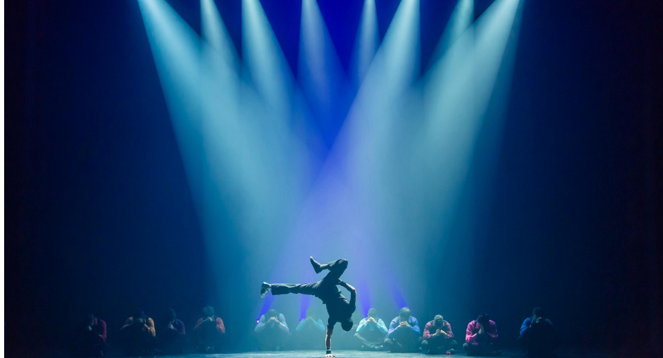
Fête de la Danse 2026, Les Echos-Liès, Positive Energy (Fribourg, Bulle)

Dans chaque ville, la Fête de la Danse déploie ses couleurs et ses rythmes. Spectacles à ciel ouvert, performances en salle, battles vibrants, cours accessibles à toutes et tous, soirées festives et propositions des écoles de danse locales composent un paysage vivant, en constante métamorphose. Au fil des jours, les corps s'élancent, les styles se croisent, les énergies circulent. Du classique à l'urbain, des pratiques amateurs aux créations professionnelles, la danse devient un langage commun, un terrain de rencontre où chacune trouve sa place.